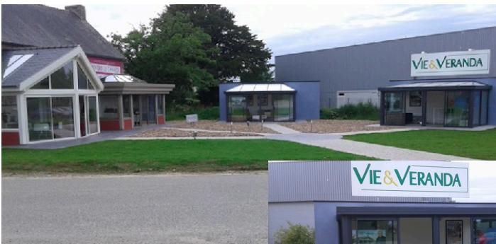
Concept Design Ouest, Quimperlé

Avec cette nouvelle agence à Quimperlé, VIE & VERANDA consolide sa notoriété dans le Finistère et le Morbihan et poursuit le renforcement de son maillage territorial en France.