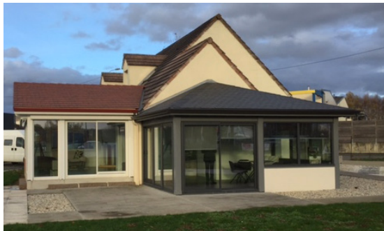
Nouvelle agence du Mans, un showroom de 300 m 2

Cette nouvelle agence est composée d'un grand showroom de plus de 300 m 2 et met en scène 5 vérandas (vérandas toiture plate Horizon, vérandas Aluminium, Amplitude et Équilibre, et 2 vérandas Extension). L'agence du Mans est dirigée par Sébastien Abache, technico-commercial issu d'une agence VIE & VERANDA de la région parisienne. Il bénéficie donc d'une très grande connaissance de l'enseigne et des produits. Cette nouvelle agence se situe dans le périmètre de la filiale VIE & VERANDA de la région parisienne et bénéficie ainsi de l'expertise logistique et organisationnelle du fabricant. Une ouverture qui laisse augurer une montée en puissance rapide.